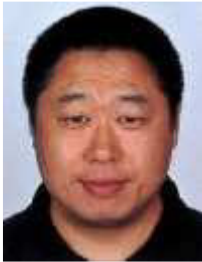
BIAN Yadong Bundestrainer Nachwuchs männlich