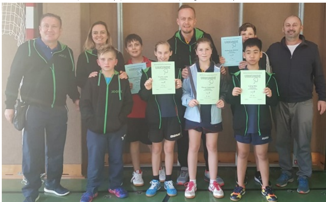
Die NÖTTV-Spieler mit ihren Eltern und Betreuern

Die BTTV-Nachwuchsliga wurde in 3 Gruppen ausgetragen, die NÖTTV-Spieler und -Spielerinnen traten in den Gruppen 2 und 3 an.