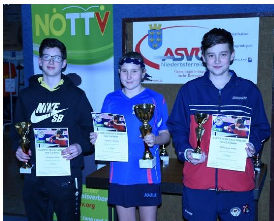
Die Sieger der Gruppe 3