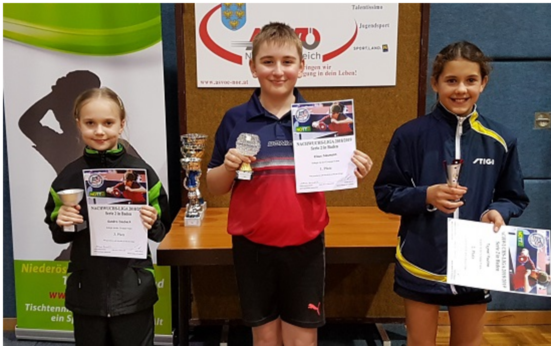
Die Pokalgewinner der Gruppe 8

Als Ausrichter wünscht sich der Badener AC für die Zukunft eine andere Regelung für „Absagen in letzter Minute“. Alles in allem war die Veranstaltung aber ein toller Erfolg und auch die Entscheidung des NÖTTV, Teilnehmer aus dem Burgenland dazu zuzulassen wurde im Allgemeinen positiv aufgenommen.