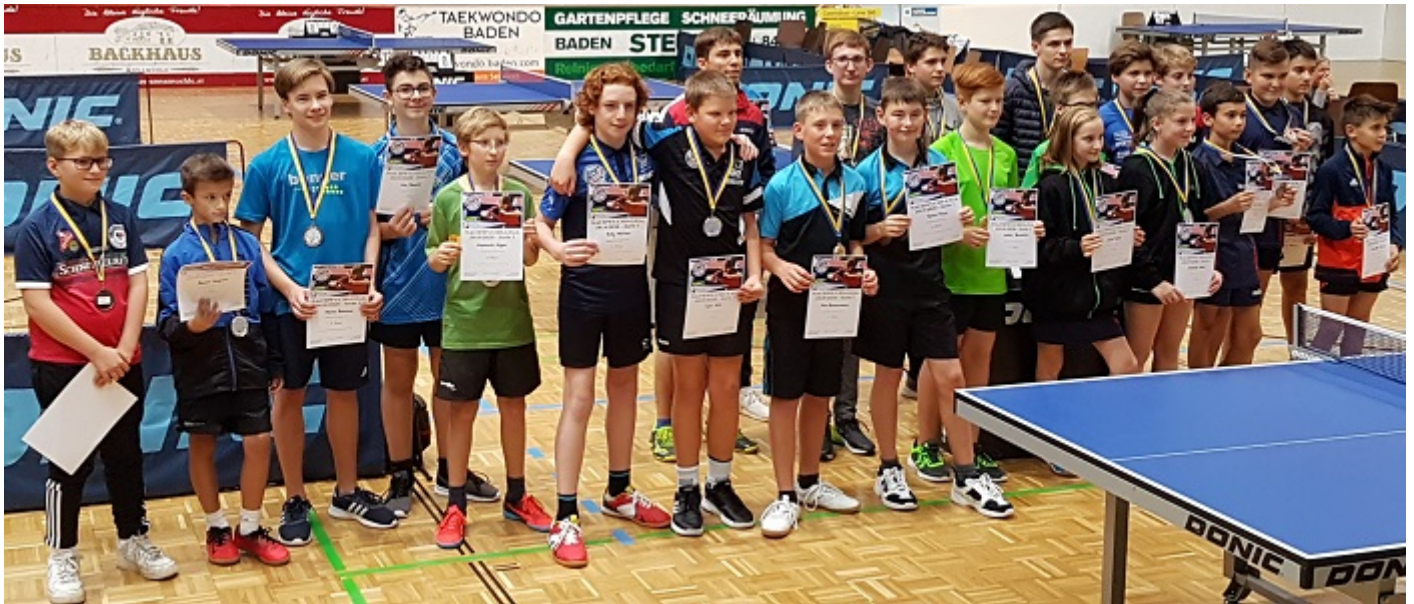
Die Medaillengewinner und -Gewinnerinnen der 1. NÖTTV Nachwuchs-Liga 2019/20 in Baden.

In Abwesenheit der Topspieler, die anschließend am Samstag und Sonntag bei den Landesmeisterschaften im Einsatz waren, fanden trotzdem 64 Spieler, davon wieder einige aus dem Burgenland, den Weg in die Sporthalle.