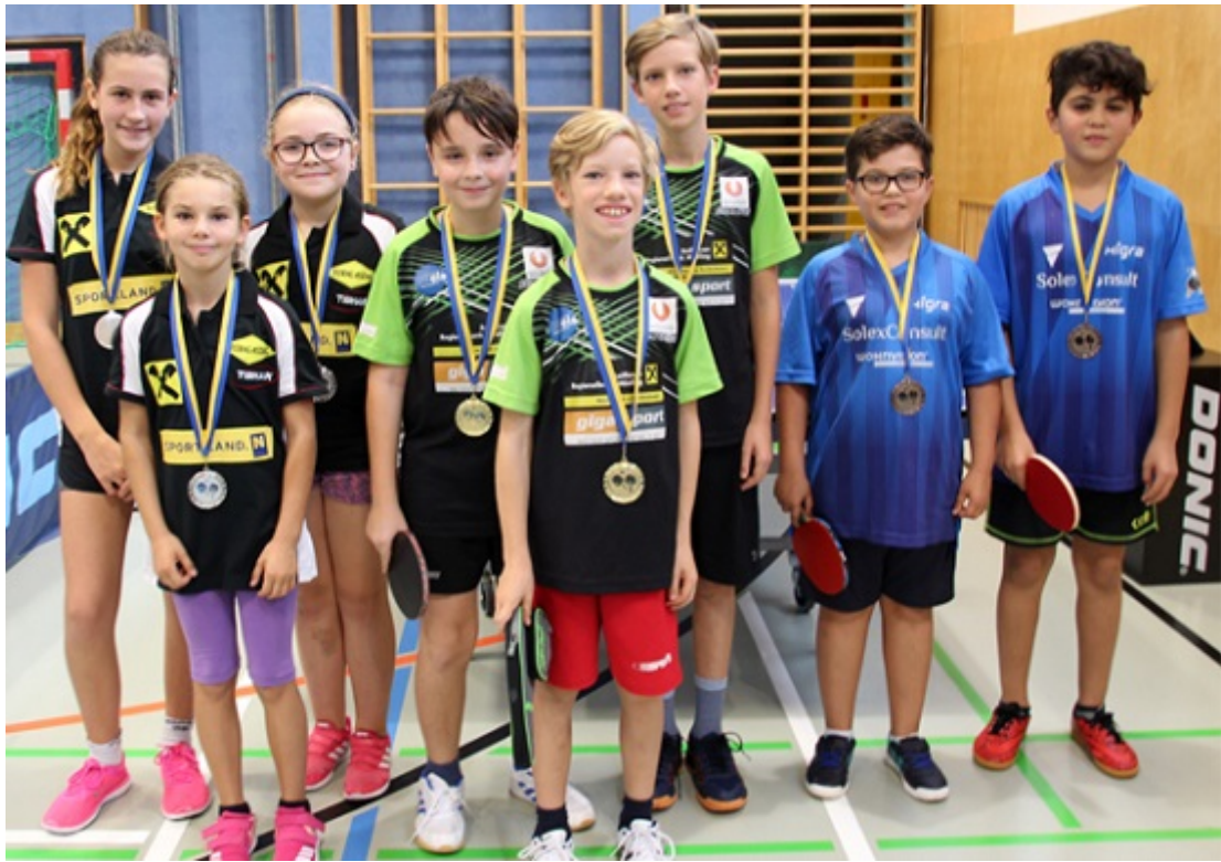
Gewinner der ZM U13 2. Klasse Süd.