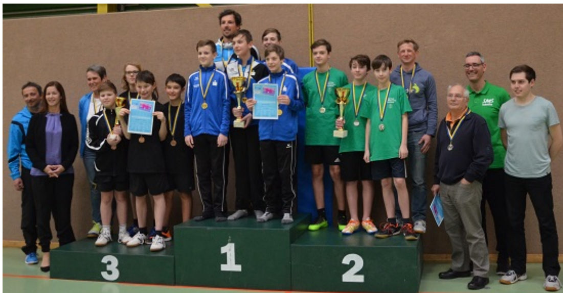
Siegerehrung der Vereinsspieler.

Bei den Vereinsspielern ging der Landesmeistertitel so wie im Vorjahr ins Mostviertel. Die SMS Amstetten gewann zum zweiten Mal hintereinander alle drei Spiele und sicherte sich somit diesen Titel. Dahinter folgte die NMS Pöchlarn, die sich knapp gegen das BG/BRG Stockerau durchsetzen konnte.