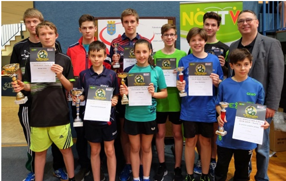
Die Sieger/innen der Gruppe 2, 3 und 5.