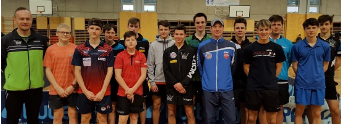
Die NÖTTV-Spieler der Gruppen 1 bis 5 männlich mit ihren Betreuern in Feldkirchen.

Die 3. Serie der ÖTTV-Nachwuchs-Superliga 2018/19 wurde am 19. und 20.1.2019 in Kärnten bzw. Salzburg ausgetragen. 45 niederösterreichische Burschen reisten nach Feldkirchen, Faak/See und Villach, 9 Mädchen nach Kuchl.