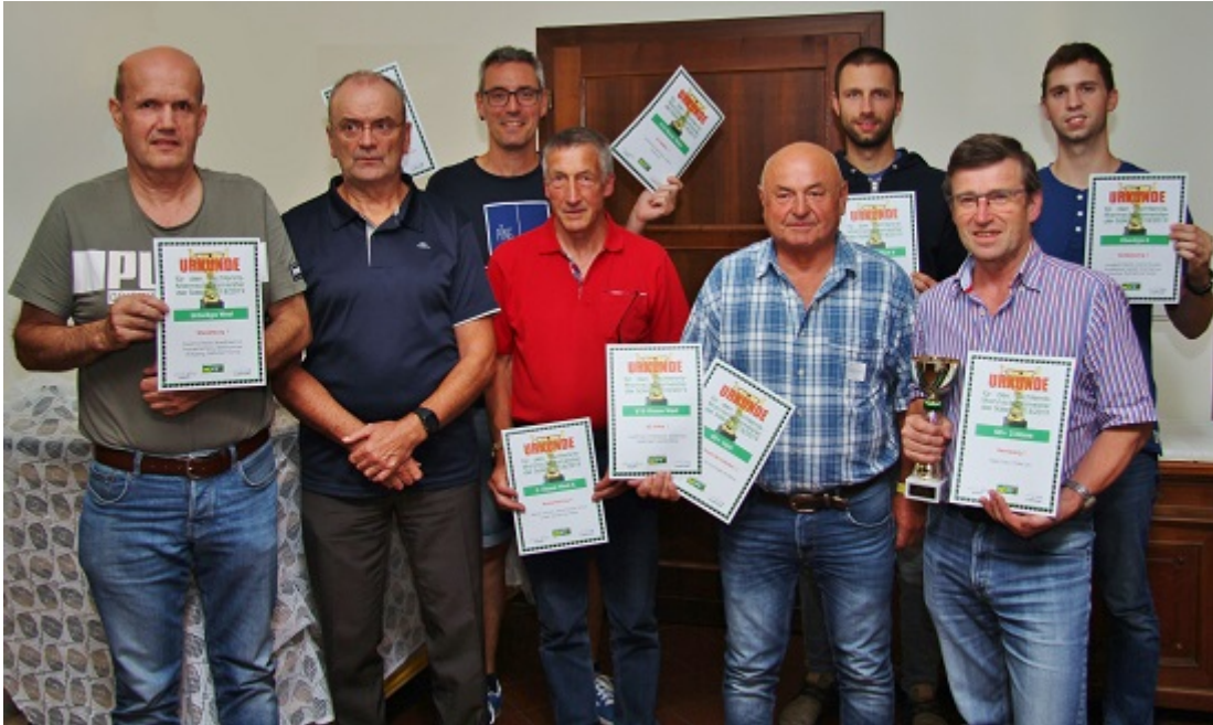
Die Vertreter der Meistervereine der Gruppe West mit den Urkunden