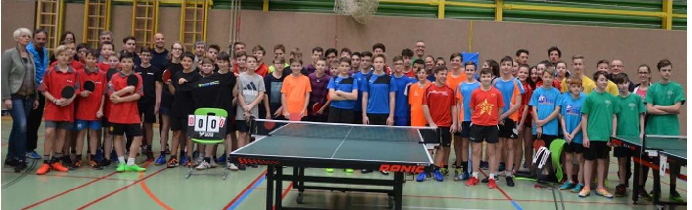
Die Ehrengäste mit den teilnehmenden Mannschaften und deren Betreuern.

Am 27. Februar 2019 fand im Freizeitzentrum Ybbs die Landesmeisterschaft der Tischtennis - Schülerliga für die Unterstufe statt.