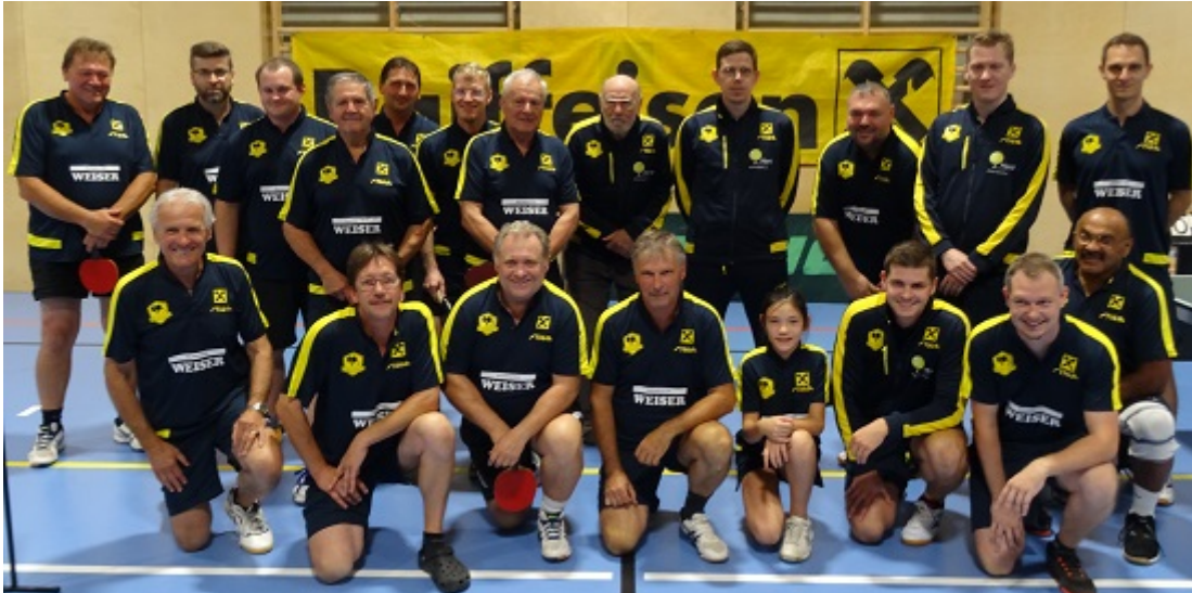
Gruppenbild SG Raika Grenzland Drösing/Zistersdorf

Die Spielgemeinschaft wurde mit dem klaren Ziel gegründet, sowohl den Breiten- als auch Nachwuchssport im Tischtennisbereich in der Grenzland Region Ost zu fördern und im sportlichen Bereich die Stärken beider Vereine zu bündeln. Mit der neu formierten Einsermannschaft ist das sportliche Ziel, innerhalb der nächsten 2 Jahre den Aufstieg von der Oberliga A in die 2. Niederösterreichische Landesliga zu schaffen.