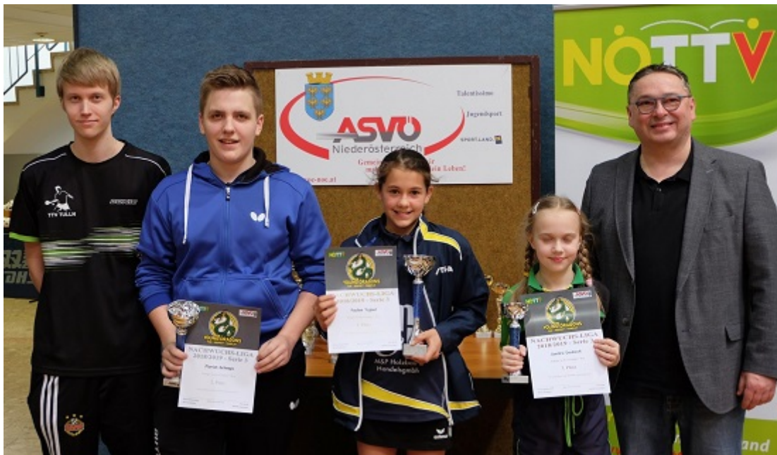
Die stolzen Sieger/innen der Gruppe 7.

Die Young Dragons bedanken sich bei allen Spielern/innen für die Teilnahme, die Disziplin und die Unterstützung der Funktionäre. Herzlich dürfen wir den Siegern und Siegerinnen zu ihren großartigen Leistungen gratulieren.