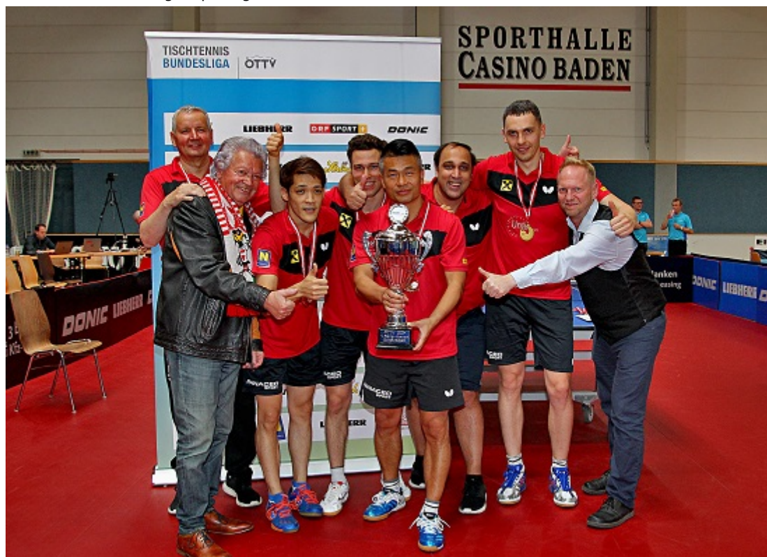
Cup-Sieger Union Stockerau

Die Union Stockerau holte sich dank eines 3:0-Finalerfolgs über ASKÖ Glas Wiesbauer Mauthausen den Sieg beim diesjährigen Tischtennis Bundesliga-Opening in Baden und damit den ersten Titel der Saison.