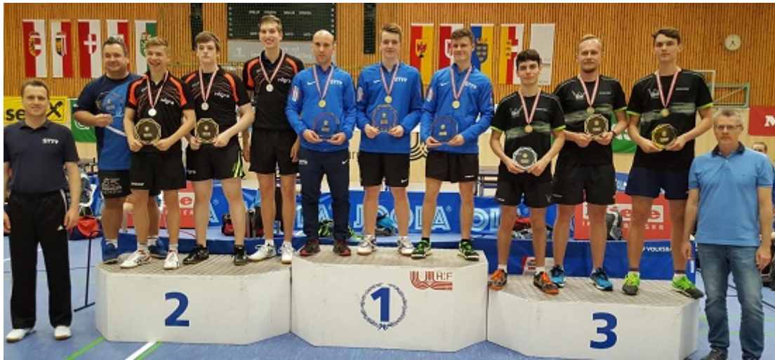
Team U21 männlich: Salzburg vor Oberösterreich und Niederösterreich