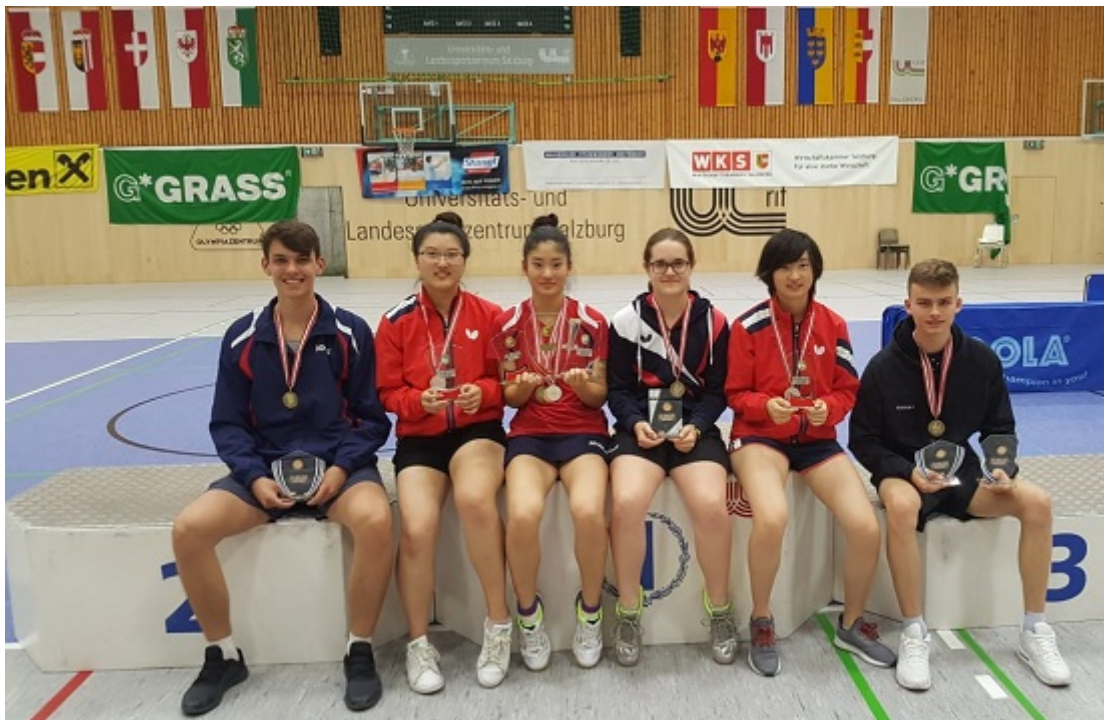
Die NÖTTV-Medaillengewinner in den Individualbewerben mit ihren Trophäen

Der NÖTTV gratuliert allen Teilnehmern der ÖM U21 ganz herzlich zu diesen Leistungen!