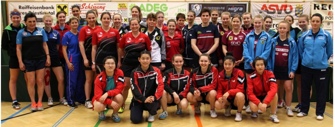
Gruppenfoto aller Spielerinnen der 2. Damen-Bundesliga

Die Spielgemeinschaft TTV Oberes Triestingtal/TTC Guntramsdorf war dieses Wochenende Ausrichter der 3. Frühjahrsrunde der 2. Damen-Bundesliga. Die Meisterschaft der Damen wird in Sammelrunden ausgetragen, wo alle Teams an einen Ort kommen und zwei bzw. drei Meisterschaftsrunden bestreiten. Der Spielort an diesem Wochenende war die schöne Ferdinand-Raimund-Halle in Pottenstein.