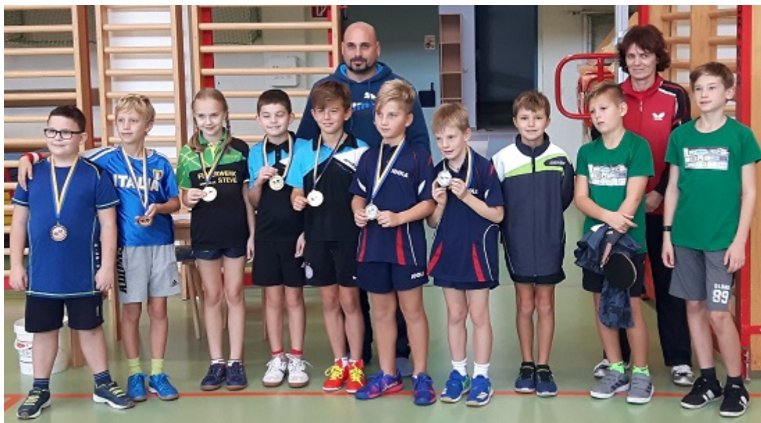
Die Mannschaften v.l.n.r. SG Stockerau/Spillern, SP Sierndorf/Matzen, SG Stockerau/Spillern und Bruck/Leitha

Am 13.10.2019 wurden die Zentralen Meisterschaften der U11 in der Region Süd/Ost in Bruck an der Leitha ausgetragen. Die vier teilnehmenden Mannschaften waren die SG Stockerau/Spillern, die SP Sierndorf/Matzen, ein Team aus Wiener Neudorf sowie eine Gastgebermannschaft aus Bruck an der Leitha. Gespielt wurde im Modus "Jeder gegen jeden", womit jedes Team drei Spiele zu bestreiten hatte.