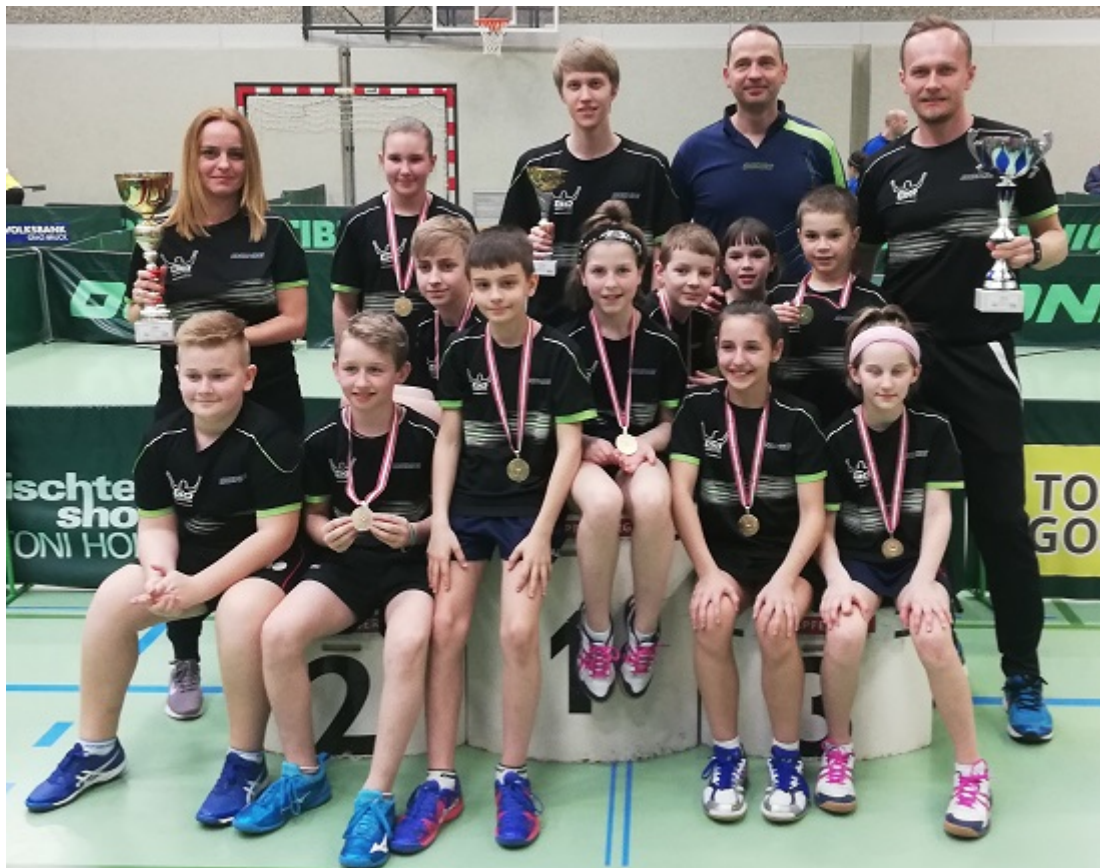
Die NÖTTV-Teams mit den Verbandsbetreuern.

Auch in den Individualbewerben waren die Spieler und Spielerinnen des NÖTTV erfolgreich: