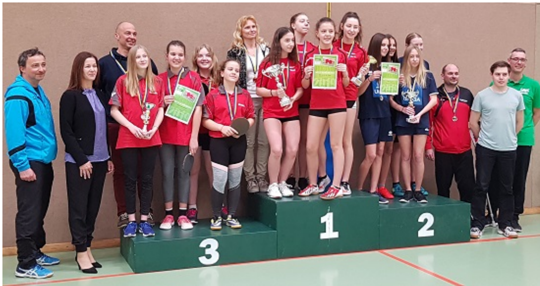
Siegerehrung der Hobbyspielerinnen.

Bei den Hobbyspielerinnen gab es mit der SMS Laa an der Thaya einen souveränen Sieger. Alle Begegnungen wurden mit 6:0 gewonnen. Im Spiel um den 2. Platz setzte sich die NMS Pöggstall mit einem 5:4 hauchdünn vor der dem ÖSTG Seitenstetten durch.