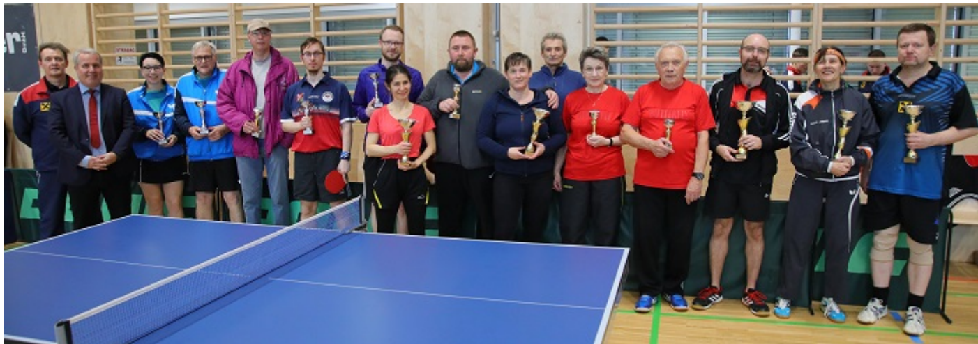
Siegerehrung Bewerb B

Den ganzen Tag herrschte reges Treiben und zahlreiche spannende Spiele verlangten jedem Einzelnen wirklich alles ab. Gestärkt am Buffet, das ebenfalls vom UTTC Raiffeisenbank Gänserndorf ausgerichtet wurde und dem Nachwuchs zugute kommt, konnten beide Bewerbe einigermaßen in der Zeit entschieden werden.