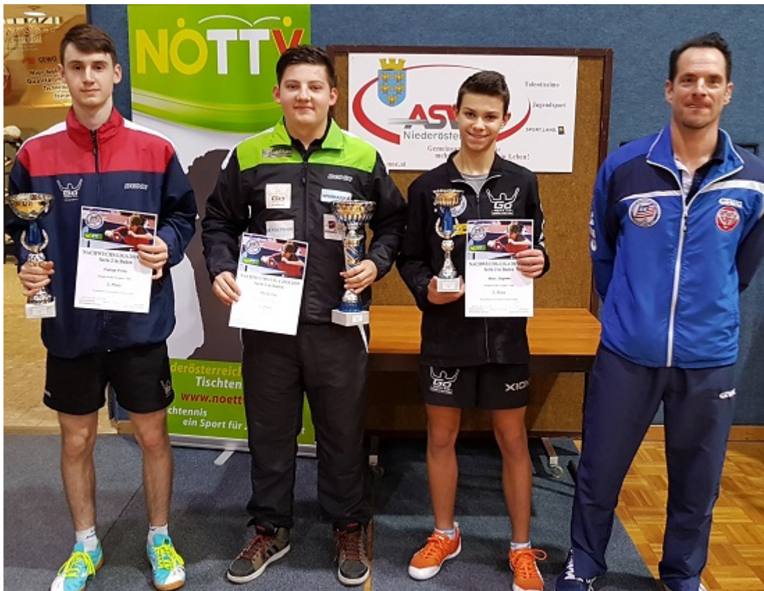
Die Pokalgewinner der Gruppe 1

98 Teilnehmer spielten in 8 nach Ranglistenpunkten gereihten Gruppen insgesamt 349 Spiele. In den Gruppen 1 bis 7 spielten je 6 TN in zwei Vorrunden-Gruppen, in Gruppe 8 je 7 TN in zwei Vorrunden-Gruppen. Nach den Vorrundenspielen wurden die Platzierungen im K.O-Modus in Kreuzspielen ermittelt. Gegen 18.30 Uhr waren sämtliche Spiele gespielt und die Ehrungen vorbei.