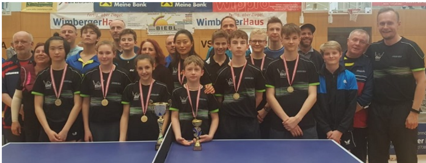
Die NÖTTV-Teilnehmer mit den Verbands- und Vereinsbetreuern.

Auch von den Österreichischen Meisterschaften U15 kehrte der NÖTTV als erfolgreichstes Bundesland nach Hause! Der NÖTTV war in Freistadt mit 3 Mädchen und 9 Burschen vertreten.