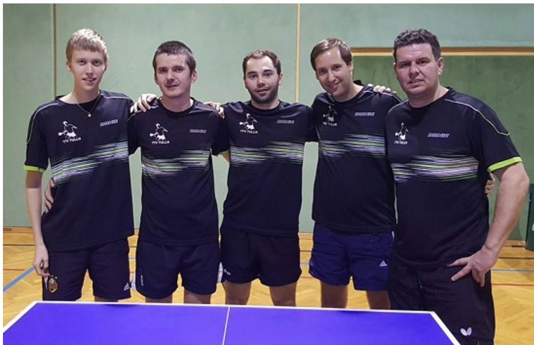
1. Mannschaft TTV Apotheke Bösel Tulln

Eine erfreulich erfolgreiche Saison geht für den TTV Apotheke Bösel Tulln zu Ende: die Tullner erreichten sechs Meistertitel!