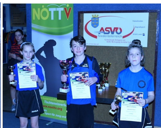
Die Sieger der Gruppe 7