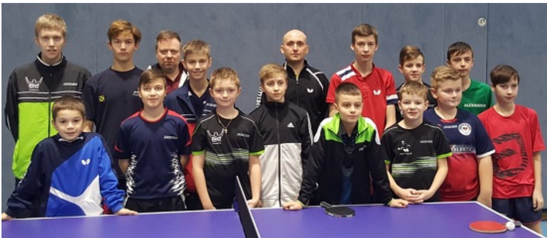
Die Teilnehmer vom NÖTTV der Gruppen 5-8 männlich mit ihren Betreuern in Faak/See.