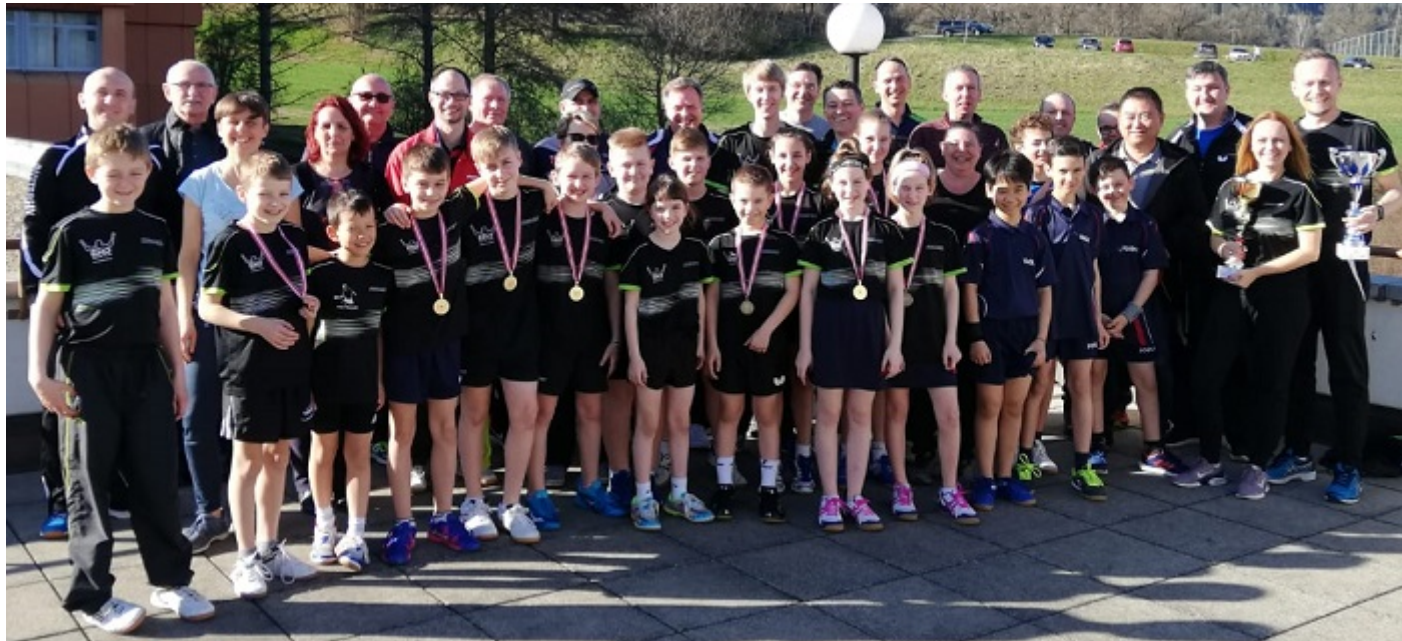
Die NÖTTV-Teilnehmer mit den Verbandsbetreuern, Vereinsbetreuern, Eltern und Verwandten.

4x Gold, 2,5x Silber und 4x Bronze - das ist die starke Ausbeute für den Niederösterreichischen Tischtennisverband bei den ÖM U13/U11 in Kapfenberg!