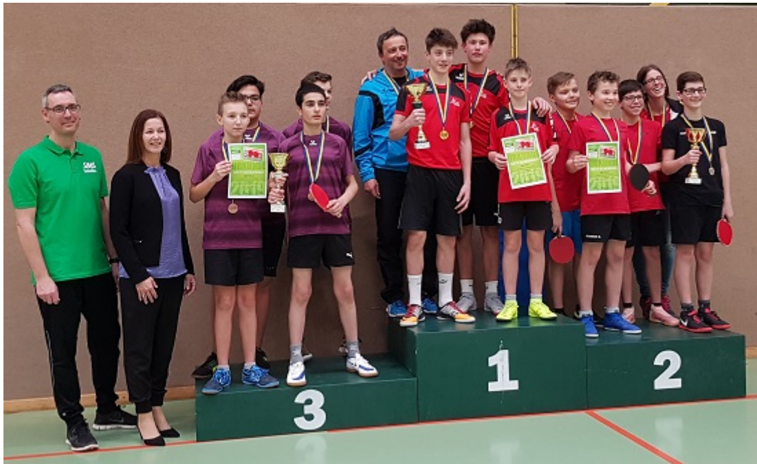
Siegerehrung der Hobbyspieler.

Bei den Vereinsspielern ging der Landesmeistertitel so wie im Vorjahr ins Mostviertel. Die SMS Amstetten gewann zum zweiten Mal hintereinander alle drei Spiele und sicherte sich somit diesen Titel. Dahinter folgte die NMS Pöchlarn, die sich knapp gegen das BG/BRG Stockerau durchsetzen konnte.