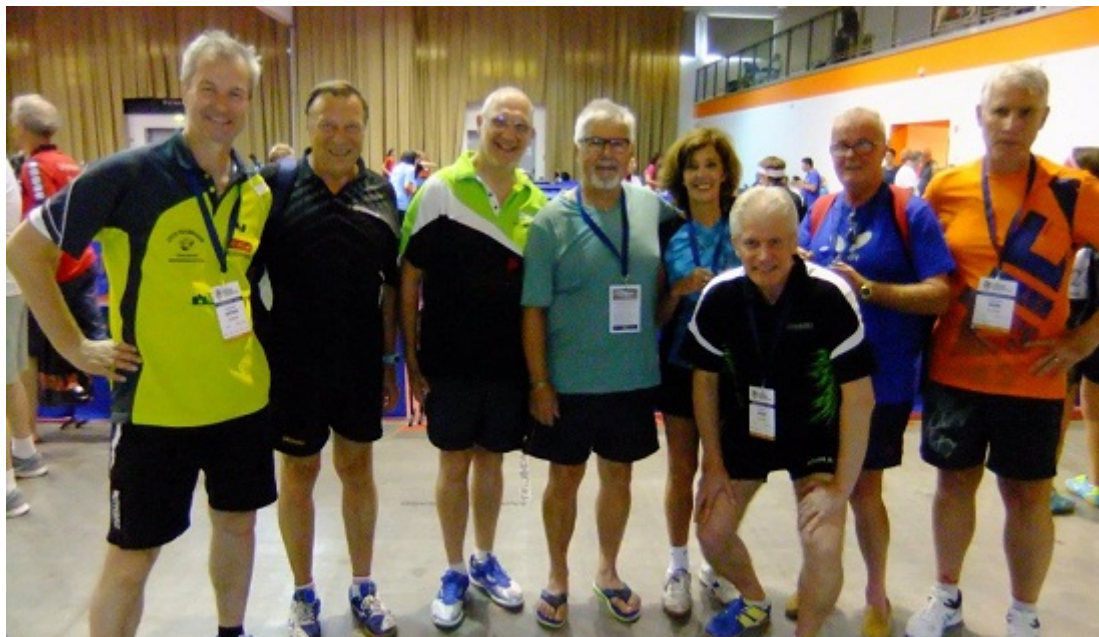
Ein Teil der NÖTTV- und WTTV- Teilnehmer/Innen

In der Zeit vom 30 Juni bis 06. Juli 2019 fanden in Budapest die 13. Senioren Europameisterschaften statt. Es waren 3500 Teilnehmer/Innen am Start, davon 97 aus Österreich, aus Niederösterreich namen 34 Spieler/Innen teil.